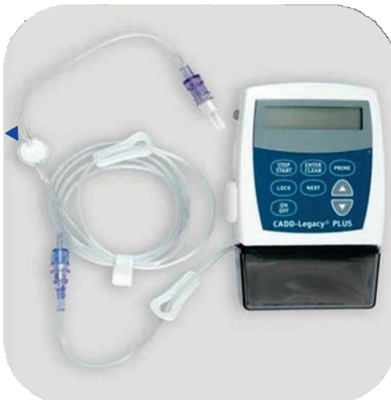
Filtr 0,2 mikrometru

Některé hadičky jsou vybaveny filtrem odstraňujícím bakterie, které se dostanou do systému. Pokud na hadičce filtr instalován není, zapojte do systému mezi pumpu a konektor filtr (s póry o velikosti 0,2 mikrometru) ze soupravy. Ten se denně (každých 24 hodin) mění současně s hadičkou a zásobníkem léku.