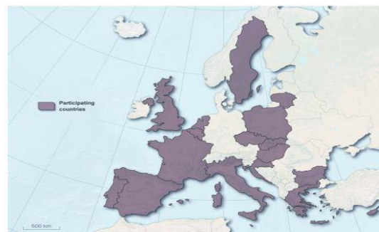
Map of participating countries.

ARTHIQS –Assisted Reproductive Technologies and Haematopoietic stem cells Improvements for Quality and Safety throughout Europe –is a 3 year European Joint Action funded by the European Commission under the 2008-13 Health Programme, dealing with Assisted Reproductive Technologies and Haematopoietic Stem cells for transplantations. ARTHIQS consortium is gathering 16 partners and 9 collaborators from 18 different Member States.